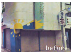
石窯ポポロ（和歌山市） …農園レストラン